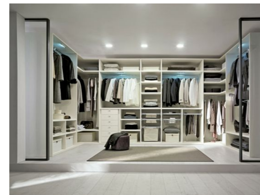
offene Ankleide für das Master-Schlafzimmer

raum in form Innenarchitektur & Architektur