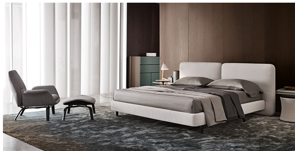
mögliche Gestaltung des Master-Schlafzimmers