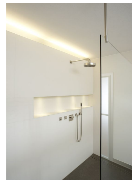
Dusche mit Glaswand