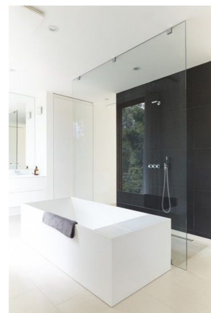
Badewanne und Dusche