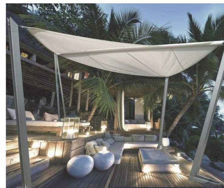
Sonnensegel zur Beschattung einzelner Bereiche