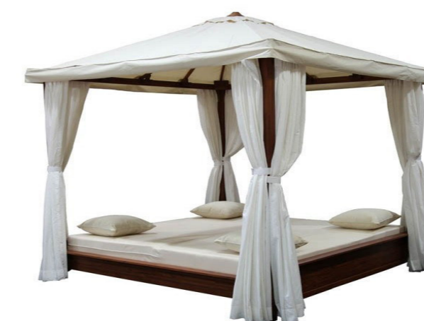
Daybed mit Sonnenschutz